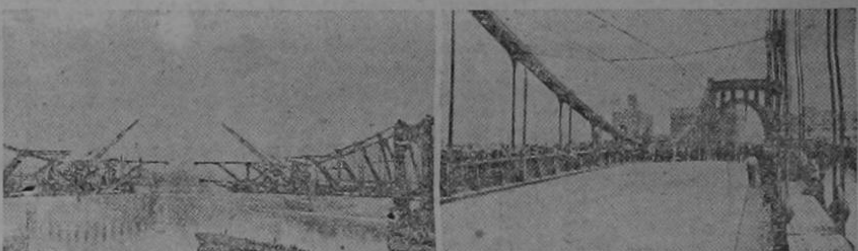
Se tendió la vigería del uno y otro lado, sin soporte alguno en medio